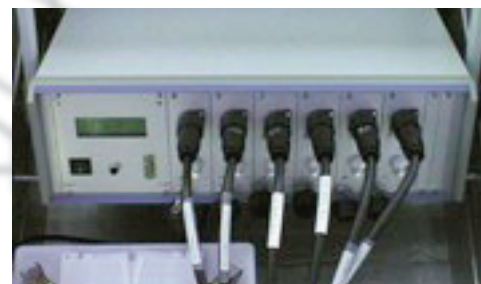
LLF-M mit 6 Meßkanälen